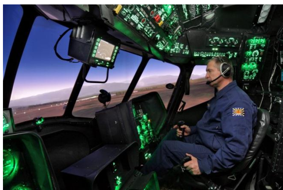
В кабине тренажера Ми-8МТВ-5