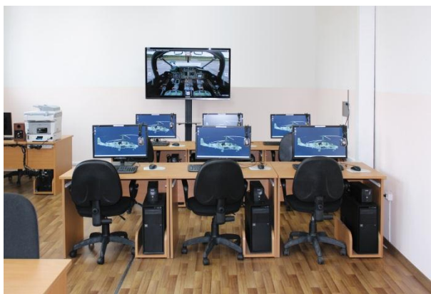
Учебный компьютерный класс теоретической подготовки на вертолет Ка-52