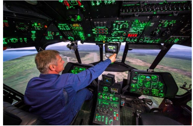
В кабине комплексного тренажера экипажа Ми-8АМТШ