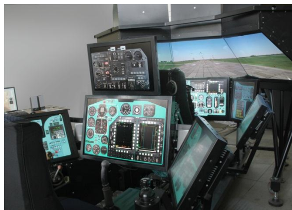
Процедурный тренажер экипажа самолета МиГ-31БМ