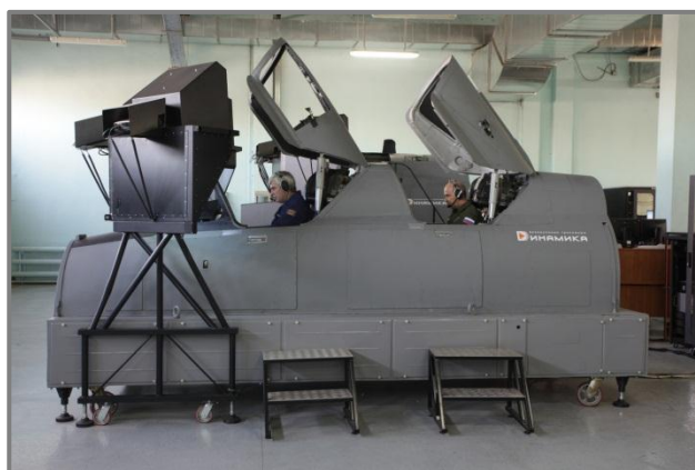
Комплексный тренажер экипажа самолета МиГ-31БМ