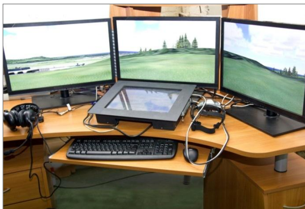
Рабочее место подготовки передового авиационного наводчика