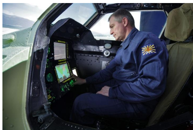
В кабине тренажера