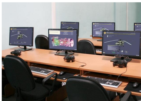
Учебный компьютерный класс для теоретической подготовки