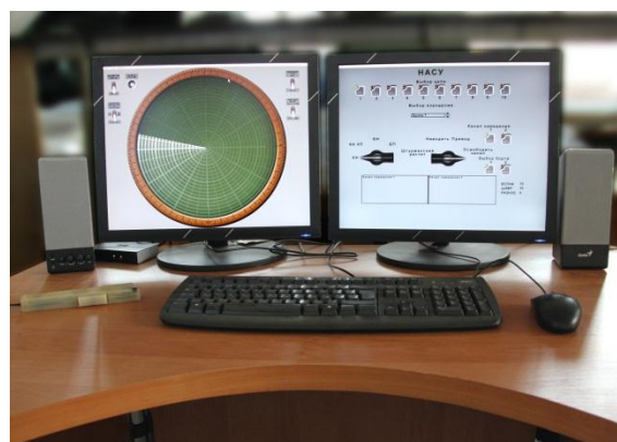
Рабочее место офицера боевого управления