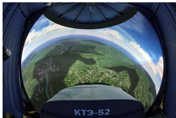
Система визуализации тренажера экипажа вертолета Ка-52