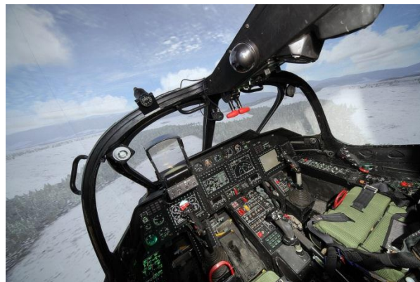
В кабине тренажера Ка-52