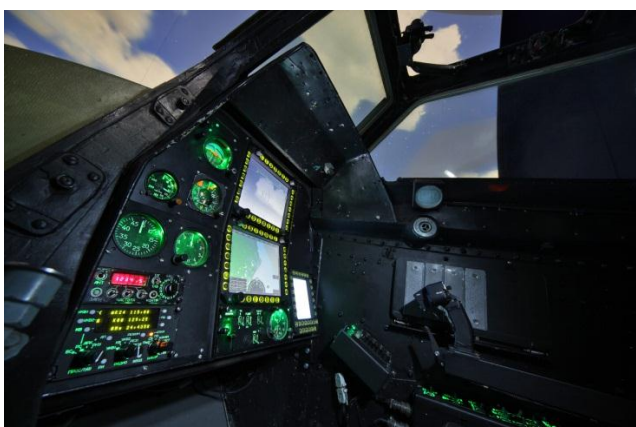
Приборное оборудование кабины тренажера