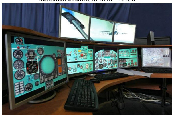
Рабочее место инструктора тренажера