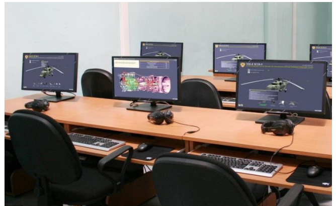
Учебный компьютерный класс