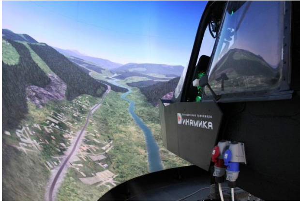
Комплексный тренажер экипажа вертолета Ми-8АМТШ