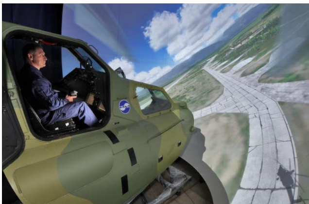
Комплексный тренажер экипажа вертолета Ми-28Н