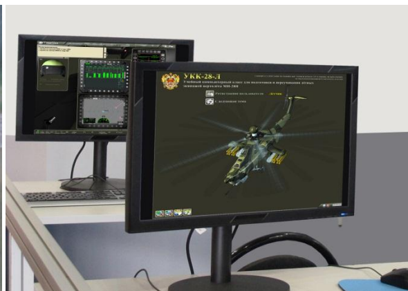
Учебный компьютерный класс теоретической подготовки на Ми-28Н