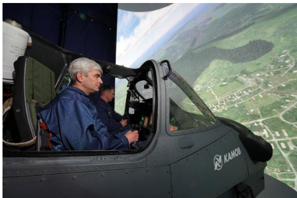
Комплексный тренажер экипажа вертолета Ка-52