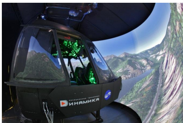
Комплексный тренажер экипажа вертолета Ми-8МТВ-5