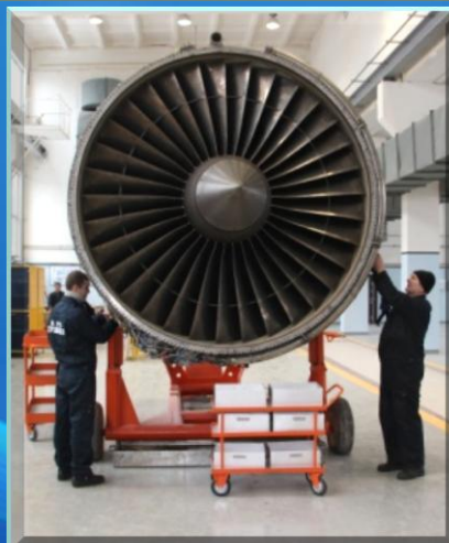
Сборка двигателя Д-18Т