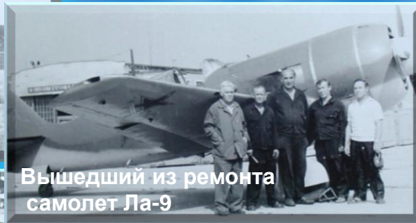
Вышедший из ремонта самолет Ла-9