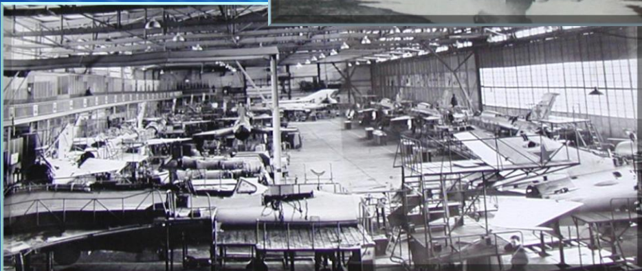
Поточный метод ремонта МиГ-21