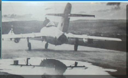
МиГ-15 перед полетом