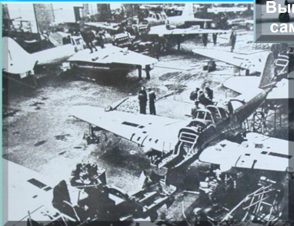
Цех ремонта Ил-2