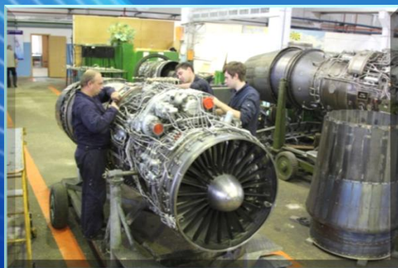
Сборка двигателя РД-33