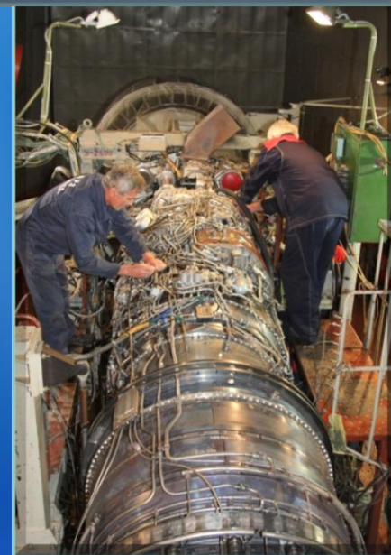
Подготовка к испытаниям двигателя АЛ-31Ф

ОАО «121 авиационный ремонтный завод» - одно из крупнейших предприятий авиаремонтной сети, выполняющее ремонт и модернизацию самолетов и авиационных двигателей фронтовой авиации