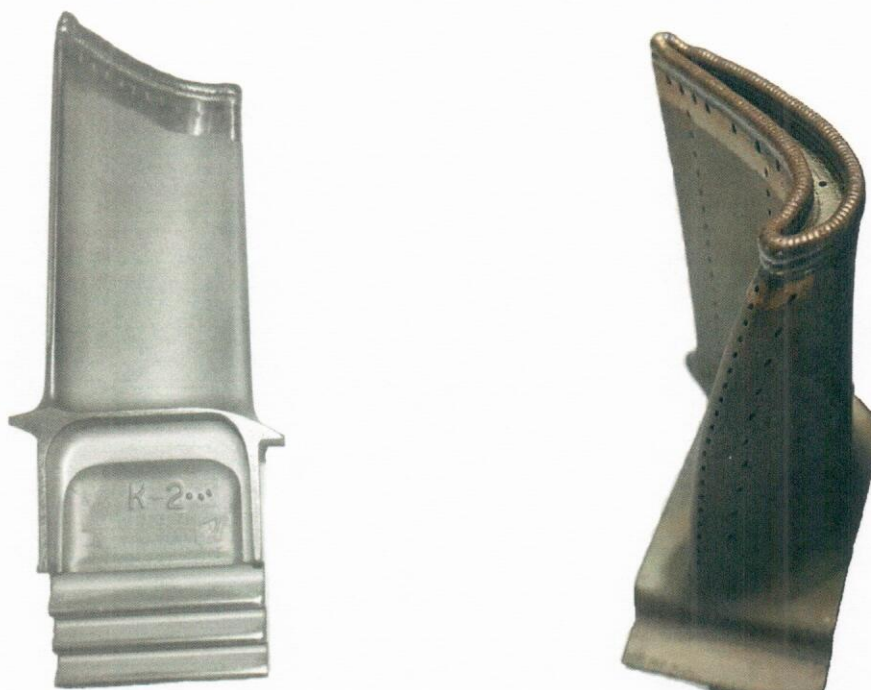
Рисунок 1 – Внешний вид восстановленной рабочей лопатки 1 ступени ТВД

В процессе отработки технологии лазерной порошковой наплавки ограниченно свариваемого никелевого сплава ЖС32-ВИ производства ФГУП «ВИАМ» получен результат обеспечивающий отсутствие горячих трещин или трещин повторного нагрева.