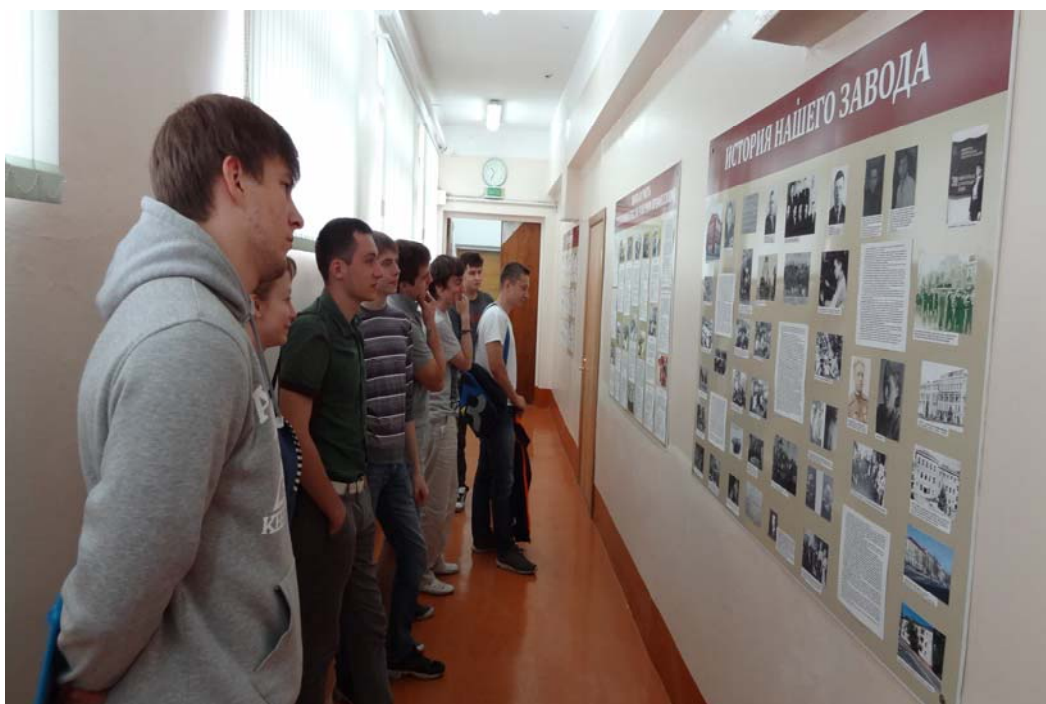
Студенты МАТИ знакомятся с историей завода по планшетам в ОПК