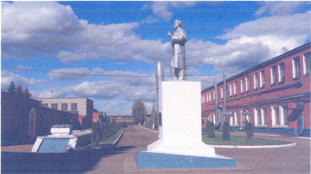
Памятник К.Э.Циолковскому установлен в 1964году.- Заводу 25 лет.

Зам. генерального директора ОАО «РПЗ» по кадрам и социальным вопросам