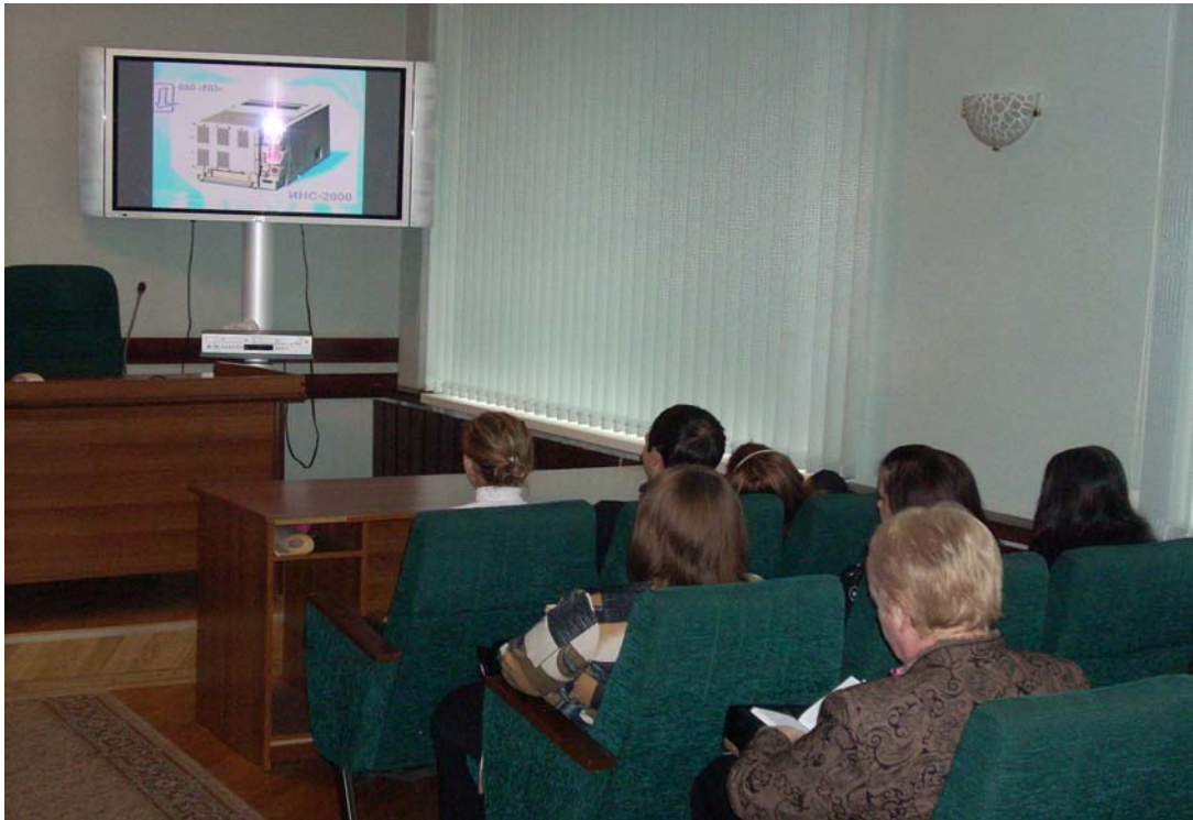
В зале заседаний студенты технического колледжа знакомятся с работой изделий ОАО «РПЗ»