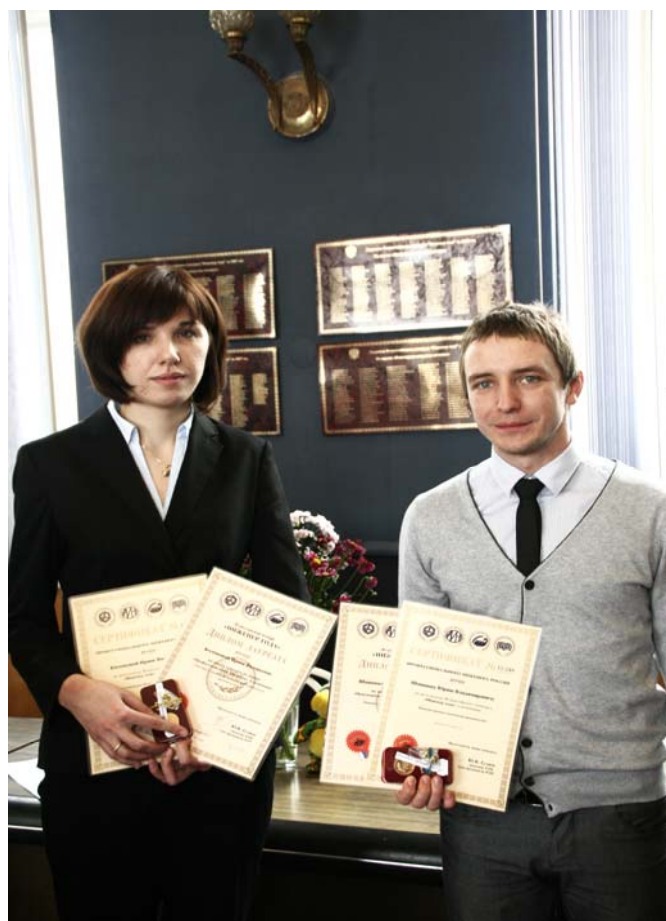
Победители конкурса авиастроителей «Инженер года»