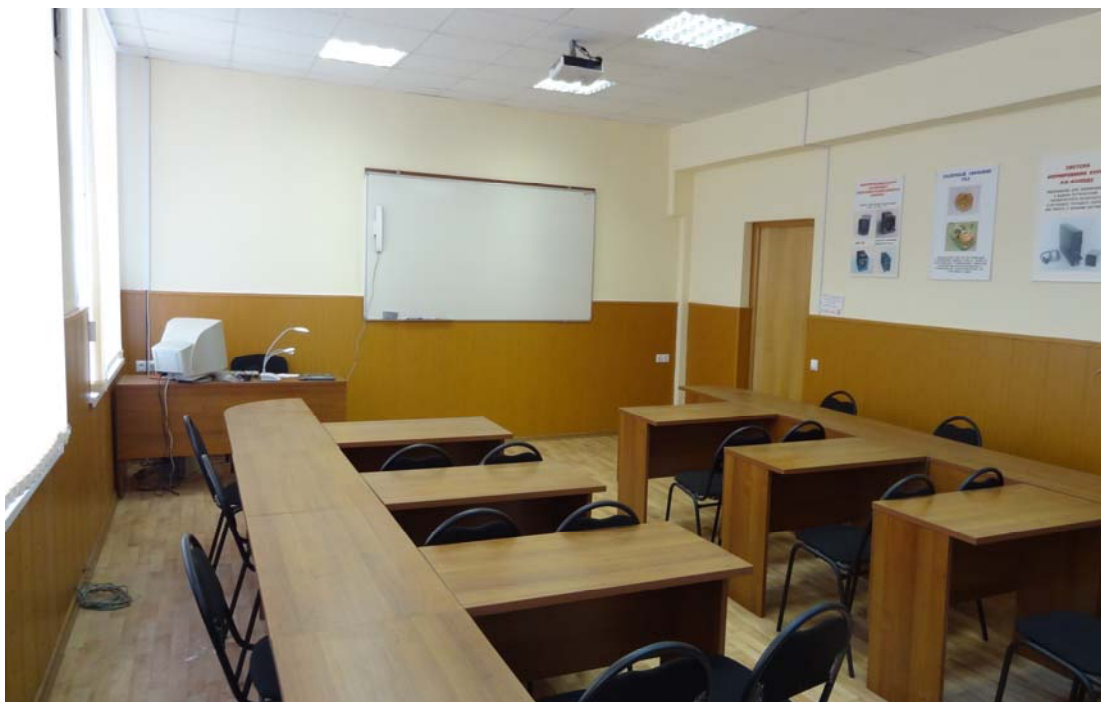
«Трансформируемый» класс в ОПК с системой интерактивного обучения