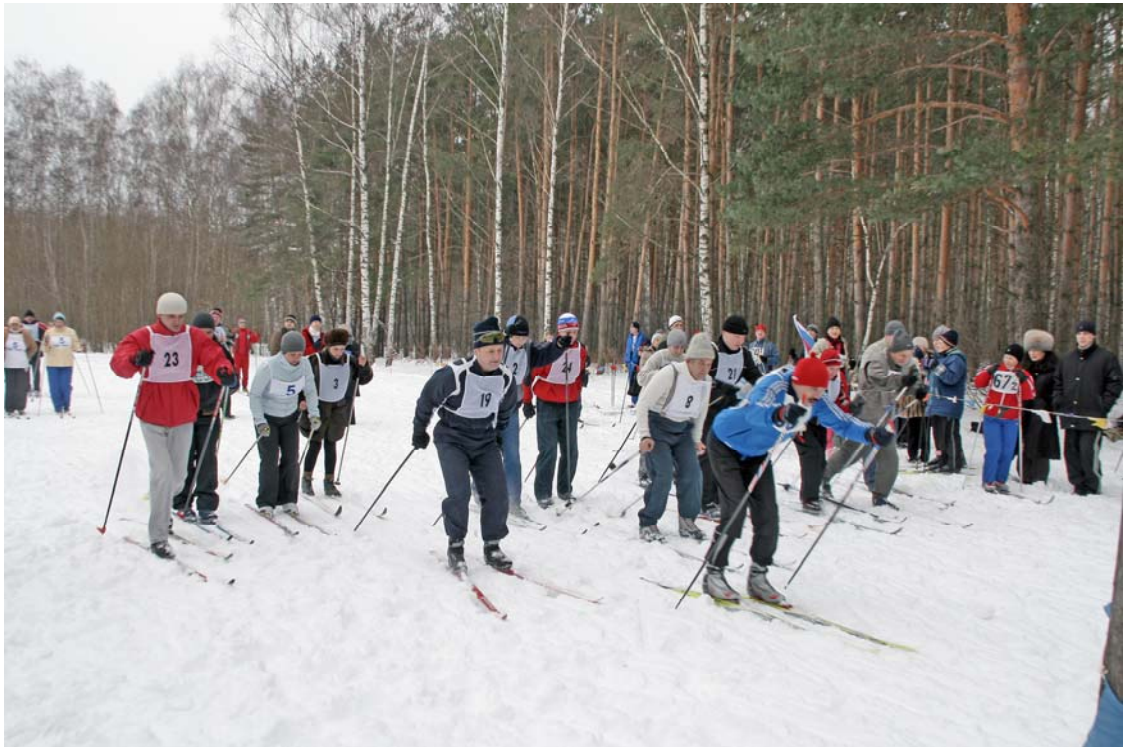
Лыжные гонки – один из зимних видов спартакиады завода