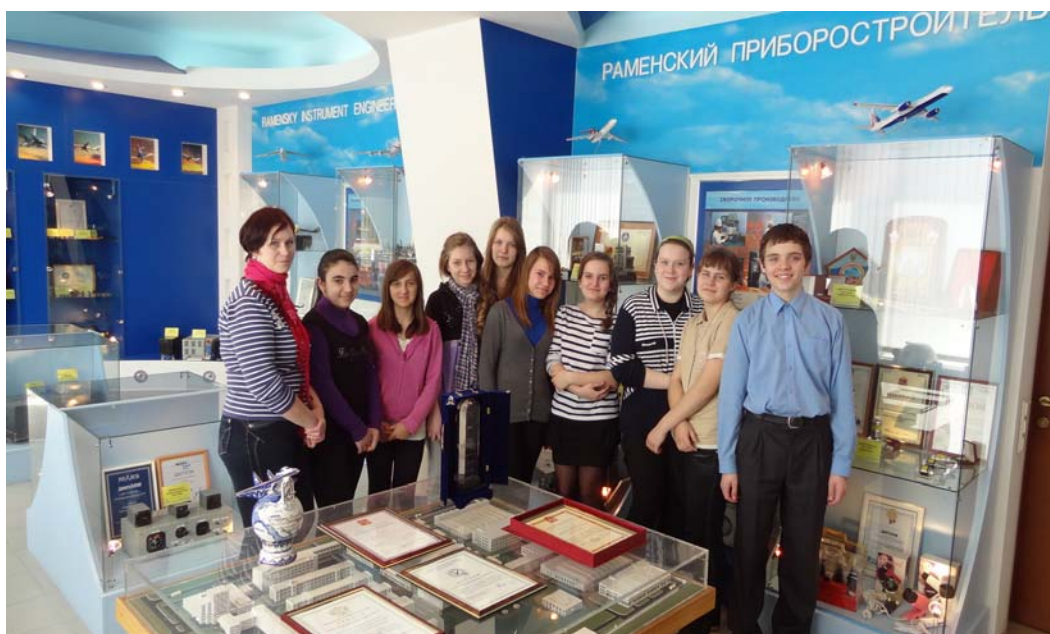
Школьники Раменской школы на профориентационной экскурсии в музее изделий завода.