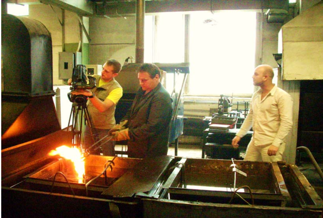
Подготовка материалов для учебных мультимедийных наглядных пособий совместно со специалистами МГТУ им. Баумана