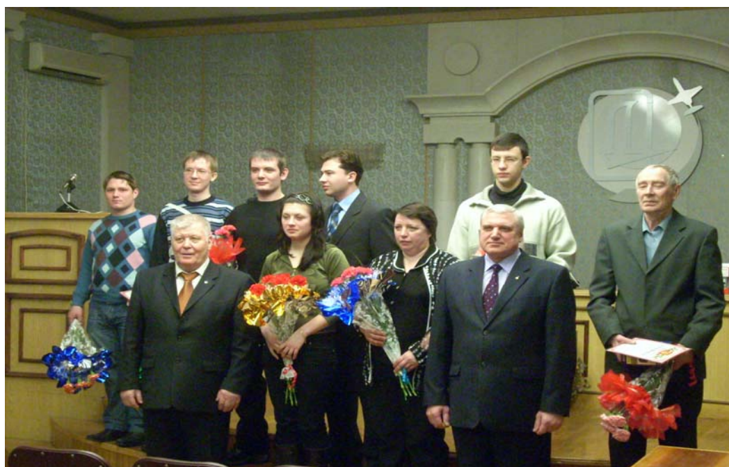
Генеральный директор и председатель профкома среди награжденных молодых рабочих и наставников на традиционной встрече с молодежью перед ежегодным Слетом Отличников Качества