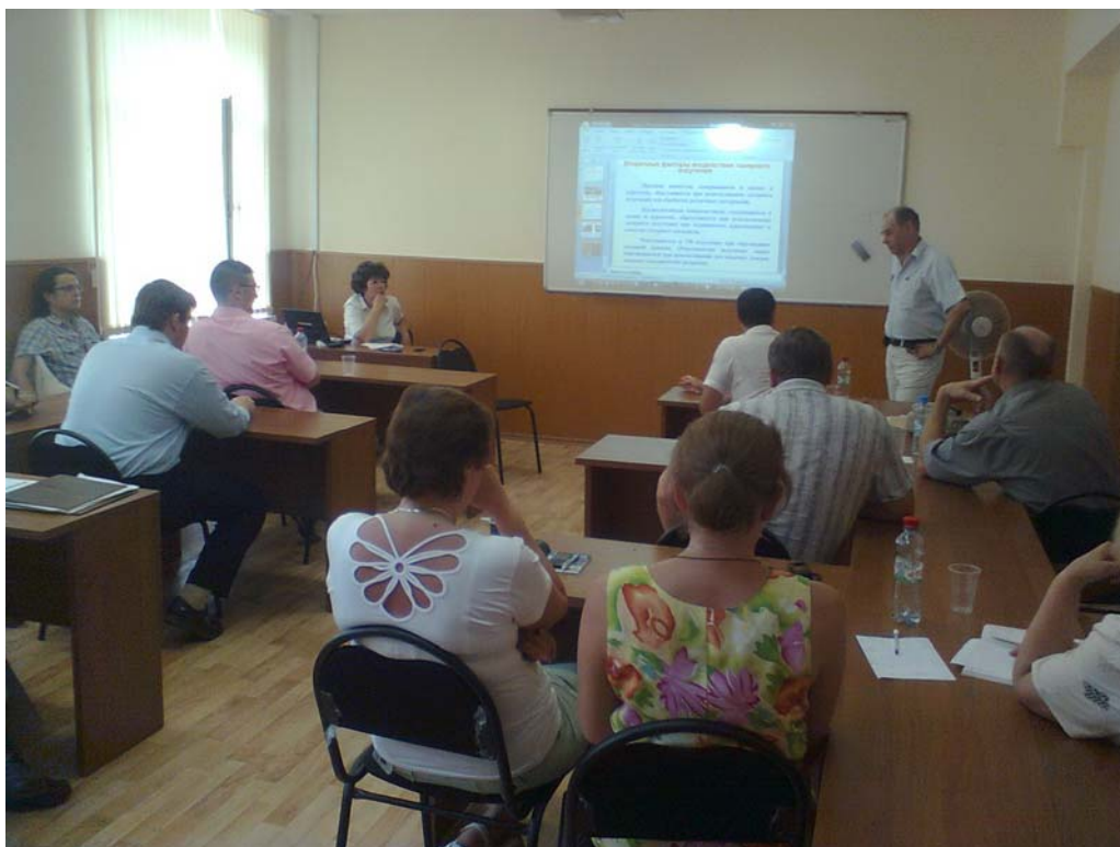
Занятия по лазерной безопасности с работниками сборочного производства проводят специалисты «Калужского лазерного инновационного центра» в аудитории ОПК