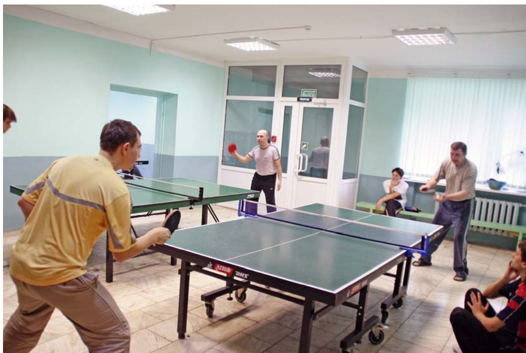
В обеденный перерыв в тренажерном зале сборочного производства.