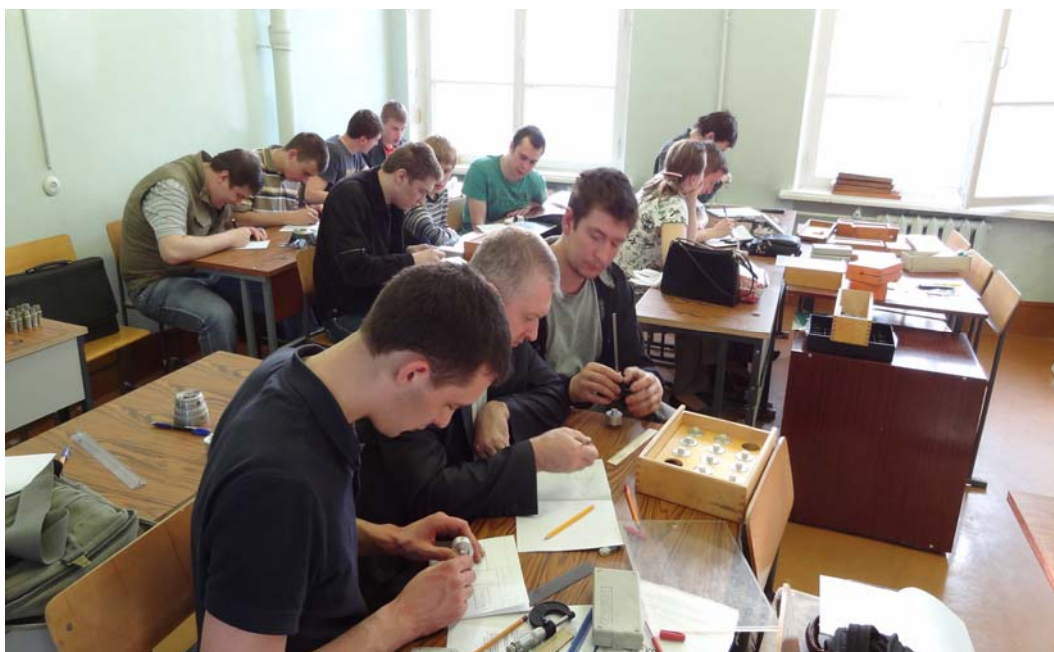
Студенты дневного отделения МАТИ на лабораторно-практических занятиях в аудитории ОПК