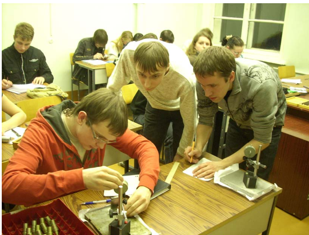
Студенты вечернего отделения МАТИ на лабораторно-практических занятиях в аудитории ОПК