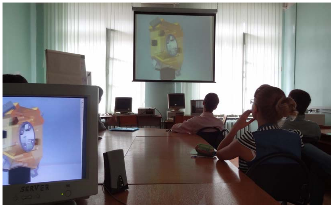
Изучение принципов работы изделий ОАО «РПЗ» студентами- практикантами ВУЗов в компьютерном классе ОПК