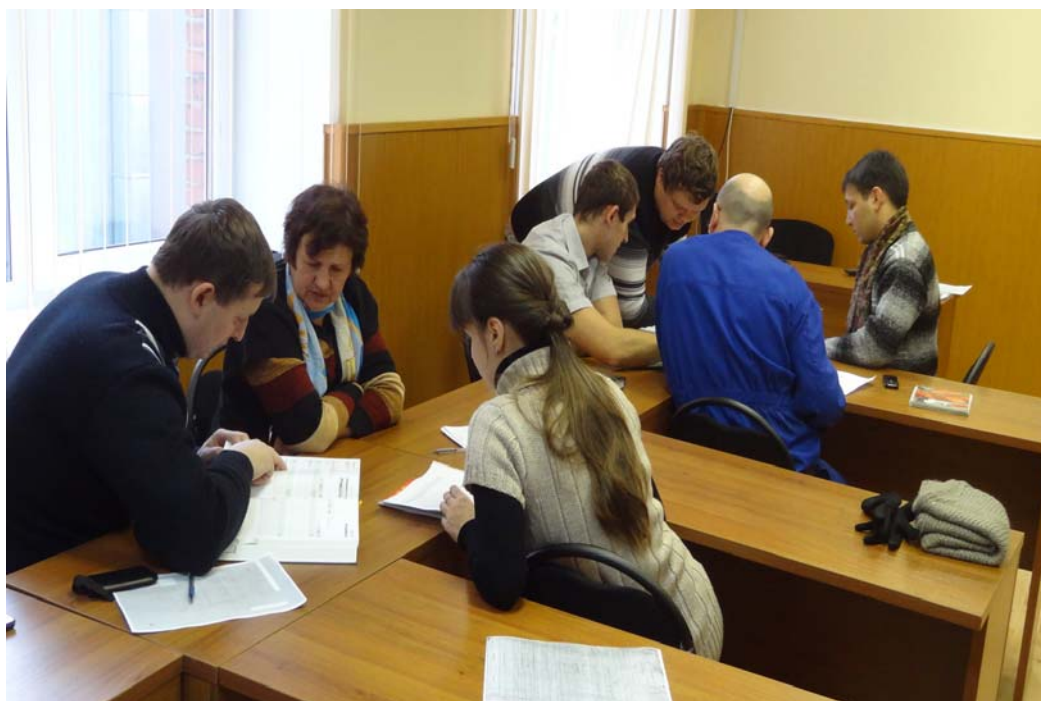
Семинар по высокоскоростным технологиям на базе современного инструмента с представителями механозаготовительного производства проводят специалисты фирмы «VALTER»