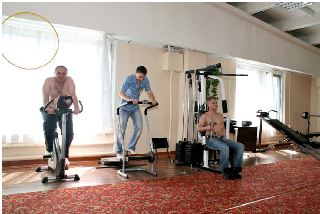
В одном из тренажерных залов механического производства